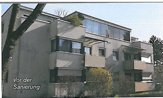
Vor der Sanierung