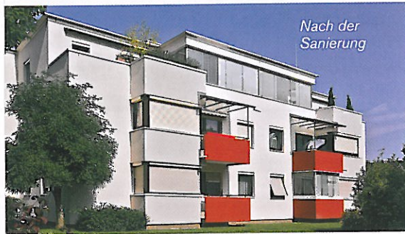
Nach der Sanierung

Wohnqualität erhöhen, Energie- und Betriebskosten senken: Die Sanierung der Wohnanlage Harderstraße in Lauterach wurde 2012 erfolgreich abgeschlossen.